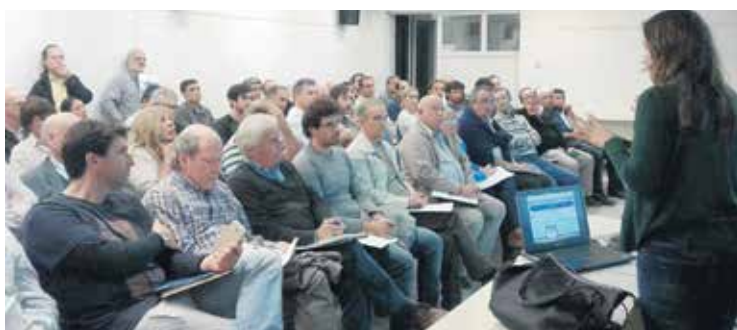
Se suman opciones a la oferta de capacitación.

Costo para matriculados habilitados y precolegiados: $ 3.600 (o 2 cuotas de $ 1.800); otros participantes $ 6.000 (o 2 cuotas de $ 3.500). Inscripción: inscripcionescursos@civiles.org.ar Más información en http://civiles.org.ar