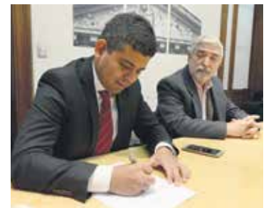
Autoridades del Colegio de Ingenieros Civiles y sus pares del Ministerio de Justicia y DD. HH., dando firma al convenio.