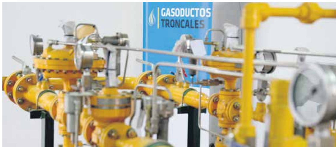
Se habilitaron dos plantas reguladoras de presión y los ramales de alimentación.

Finalmente, el gobernador Juan Schiaretti anunció el comienzo de las obras para llevar el servicio a los hogares: “Ya se ha llamado a licitación y en dos o tres meses empieza la red domiciliaria de gas natural”, dijo, y aclaró que la empresa Ecogas se hará cargo de una parte de esta red, aportando más de 14 mil metros en lo que respecta a esta construcción.