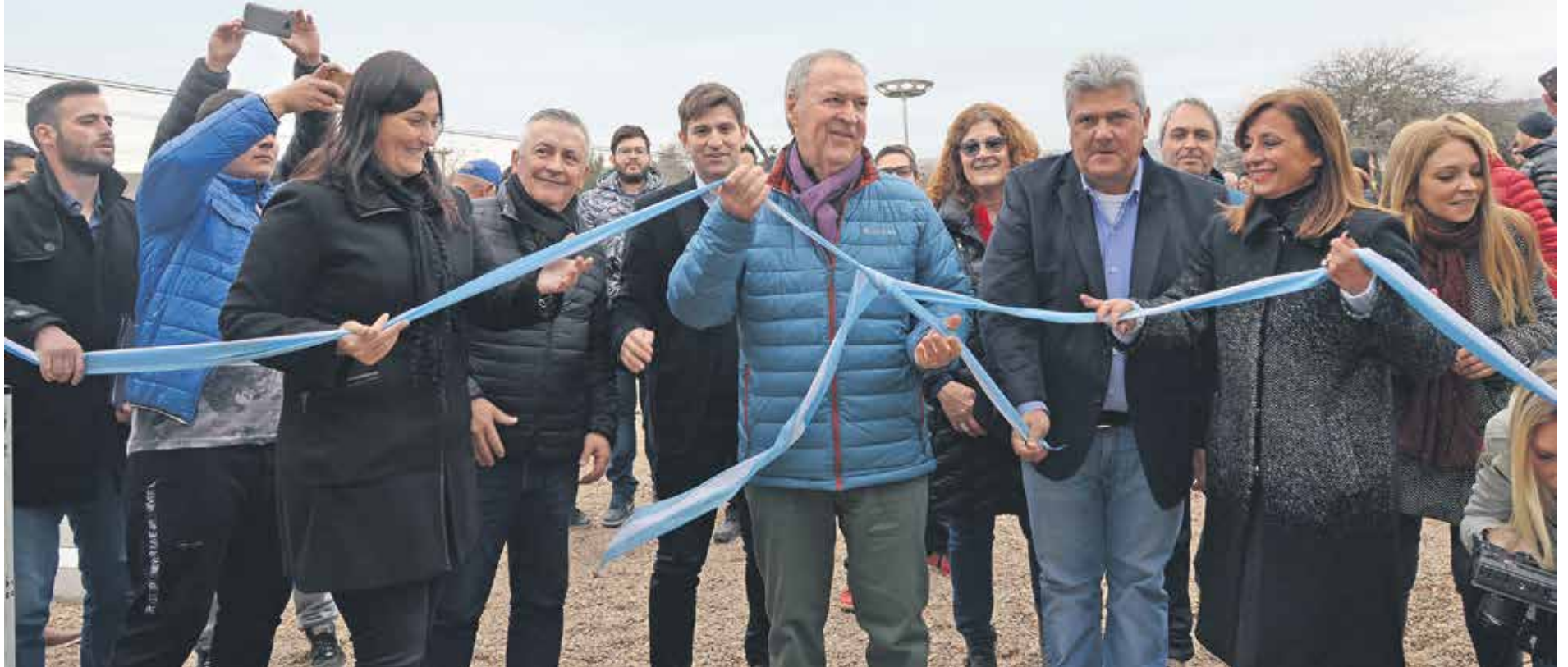
El gobernador Juan Schiaretti en los actos de habilitación de esta obra trascendental.

Se completa un nuevo tramo de los previstos para que el gas natural llegue a más cordobeses.