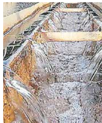
ACUEDUCTO. Córdoba-Santiago del Estero.