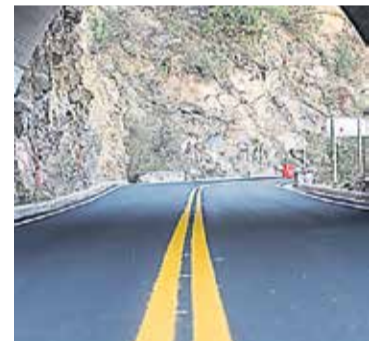
PASEO. Más de 36 kilómetros se suman a un trazado de interés nacional.