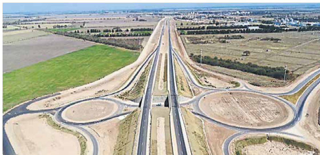
AVANCES. Continuarán las obras en la Ruta 19.

Junto al aporte de representantes provinciales de consejos y colegios de ingenieros, se busca enriquecer el Plan Nacional de Obras para el Desarrollo y así lograr un mayor desarrollo para la construcción de la obra pública en toda la Argentina.