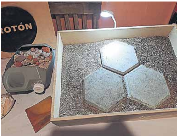
PRODUCTO. Las losetas serán parte de senderos y paseos públicos. También podrán utilizarse en estacionamientos residenciales, dada su resistencia probada.