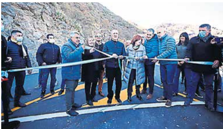
ACTO. El gobernador Schiaretti junto con funcionarios al momento de cortar cintas.