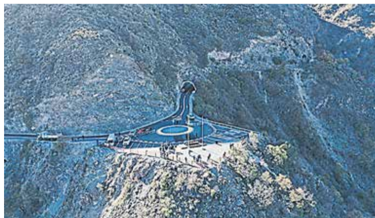
ACTUALIDAD. Vista aérea de la flamante pavimentación desde un dron.