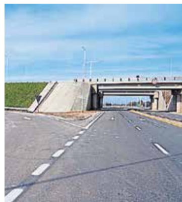
AUTOPISTA. La Ruta Nacional 158 es clave para el desarrollo regional cordobés.