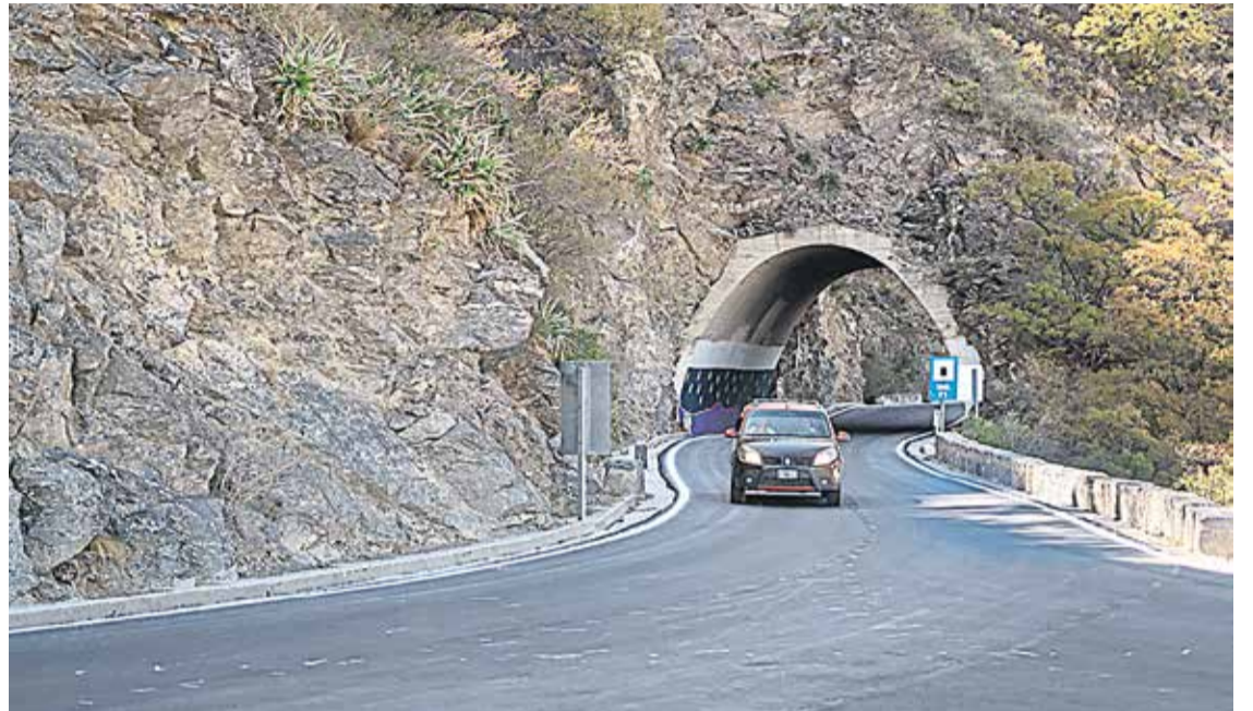
ÍCONOS. Los túneles son un referente turístico de las sierras cordobesas.

El despliegue de asfalto sobre la Ruta Provincial 28 permite disfrutar del vuelo de los cóndores, la cascada Saltos Blancos, la Reserva Natural